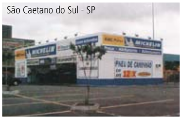
São Caetano do Sul - SP