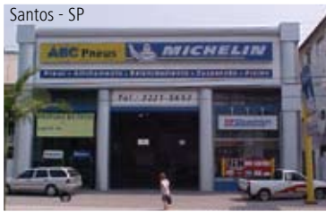
Santos - SP