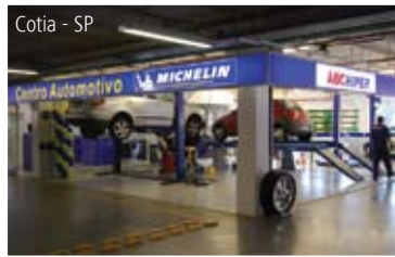
Cotia - SP