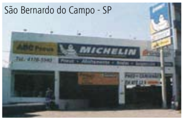
São Bernardo do Campo - SP