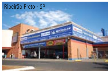
Ribeirão Preto - SP