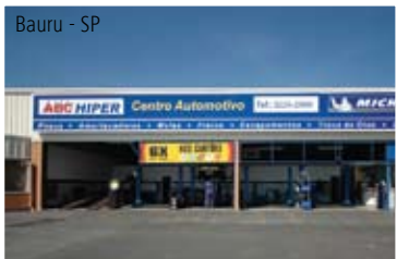
Bauri - SP