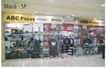
Mauá - SP