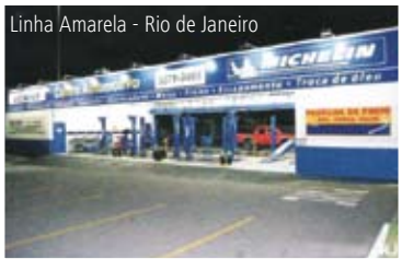
Linha Amarela - Rio de Janeiro