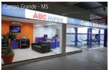
Campo Grande - MS